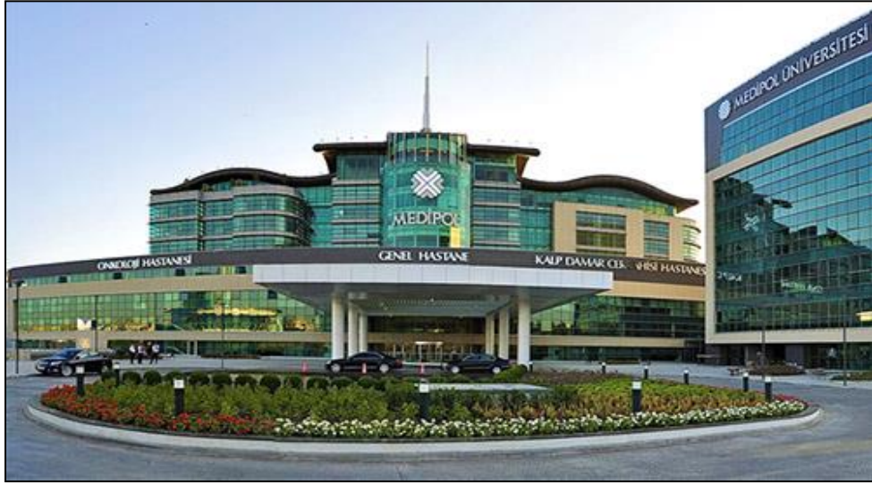
Özel Medipol Mega Hastaneler Kompleksi