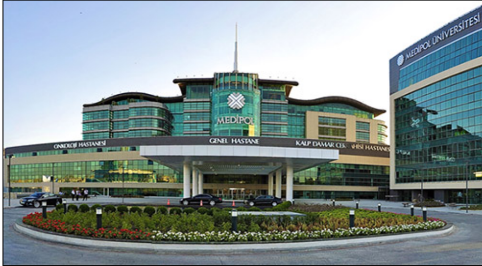
Özel Medipol Mega Hastaneler Kompleksi