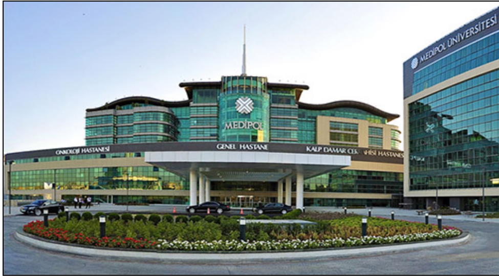
Özel Medipol Mega Hastaneler Kompleksi