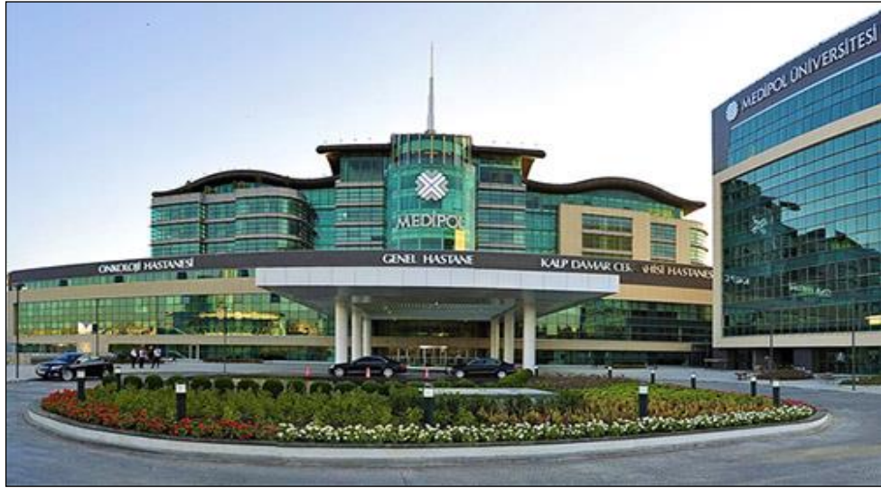
Özel Medipol Mega Hastaneler Kompleksi