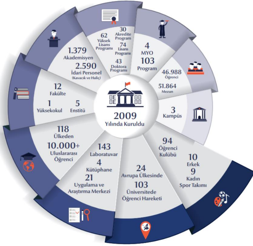
Şekil 1 Sayılarla Medipol

https://www.medipol.edu.tr/universite/sayilarla-medipol