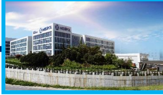
Kavacık Kuzey Kampüsü