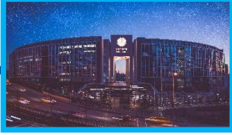
Kavacık Güney Kampüsü

Üniversitemiz dört ayrı kampüste faaliyetini sürdürmektedir: Kavacık (Kuzey ve Güney), Haliç (Unkapanı), Bağcılar (Medipol Mega Üniversite Hastanesi), Esenler.