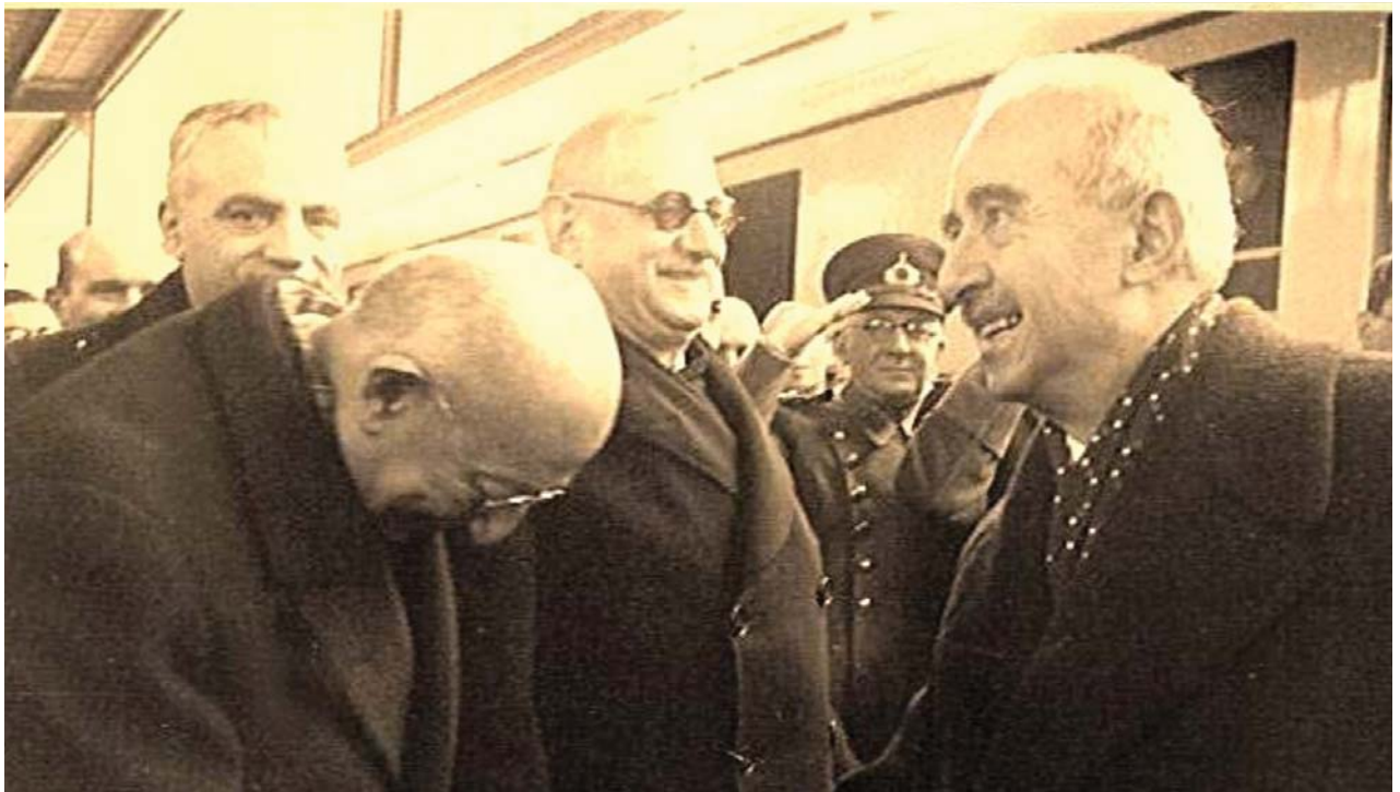
Cumhurbaşkanı İnönü'nün Başbakan Dr. Refik Saydam tarafından karşılanması.

geçti. Akabinde, girmiş olduğu Askerî Tıbbiye'den 22 Ekim 1905'de, 1225 numaralı diploma ile ve Hekim Yüzbaşı rütbesiyle mezun oldu. Mezuniyet sonrası klinik çalışmasını tamamlamak üzere Gülhane Hastanesi'ne verildi. 29 Temmuz 1907'de 3. Ordu emrine atanmasına rağmen bir yıl daha Gülhane'de kalarak Histoloji ve Embriyoloji şubesinde çalıştı. Daha sonra Harbiye Nazırı Mahmut Şevket Paşa'nın emri üzerine, 11 hekim, 3