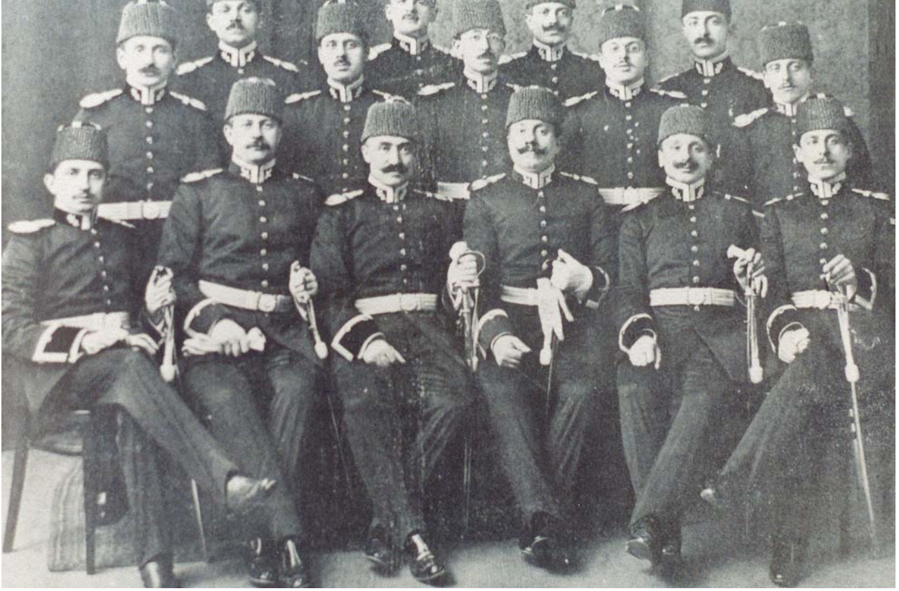
Almanya'ya eğitime giden kafilemiz.

eczacı ve kimyager ile 3 veteriner subaydan oluşan bir grupla 4 Ağustos 1910'da Almanya'ya gönderildi. Almanya'da, önce Berlin Askerî Tıp Akademisi'nde kurs gördükten sonra Brandenburg 6. Zırhlı Süvari Alayı'nda staj yaptı. Alman Ordusunun manevralarına, Alman Sahra Sıhhiye Subayı gibi katıldı ve tekrar Berlin'e dönerek ünlü Scharite Kliniği'nde yüksek geliştirme eğitimi gördü.