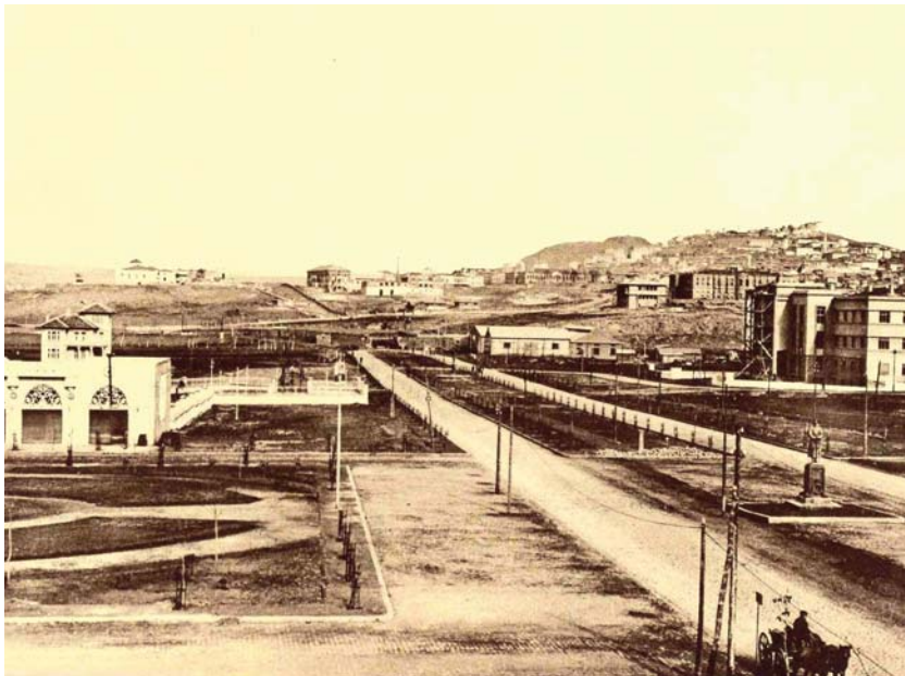
Dönemin Ankara'sından bir görünüm