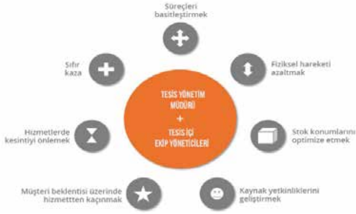
Şekil 2: Tesis Yöneticisi Yetkinlikleri

hizmet sunmaktır. İlgili işlevin yürütülmesini sağlayan kişi, yönetici olarak ifade edilmektedir. Bu sebeple binaların, tesislerin etkin bir şekilde işletilmesi, yürütülmesi ve bakımından sorumlu olan kişiye de "tesis yöneticisi" denilmektedir.