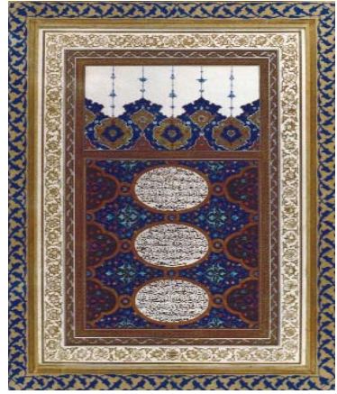
Prof. Dr. Süheyl Ünver'in, Medresetü'l Hattâtın'dan aldığı icazetname 1923.

A. Süheyl Ünver, çalışma düzenini ve hayat programını, çevresine örnek olacak biçimde kurmuş bir ilim adamı ve sanatkâr kimliği içerisinde, bulunduğu her çevrede etrafına ışıklar saçmıştır. Tıp tarihinin önemli bir konusu olan deontoloji alanında hekimin ahlâki sorumluluklarını hem öğretmiş hem de hayatını ve davranışlarını misal olarak ortaya koyarak derslerinde söylediklerinin canlı bir sembolünü oluşturmuştur. 20. yüzyıl Türk kültürünün eskiyle kopan bağlarının kurulmasının ve unutulmuş geleneksel sanat dallarından pek çoğunun canlandırılmasının en sadık ve vefakâr hadimi olmuştur. Tıp tarihi ve Türk tezyinat tarihi ona giderek Türk tarihine dair en hurde ayrıntıları öğretmiş, sonuçta, Türk'ü ilgilendiren tek yapraklı bir arşiv malzemesinden mezaristanlardaki tarihi taşlara dek hiçbir şeyi kaçırılmayıp tespit etmesi, Türk kimliğini ayakta tutacak her unsura dikkatle eğilmesine neden olmuştur.