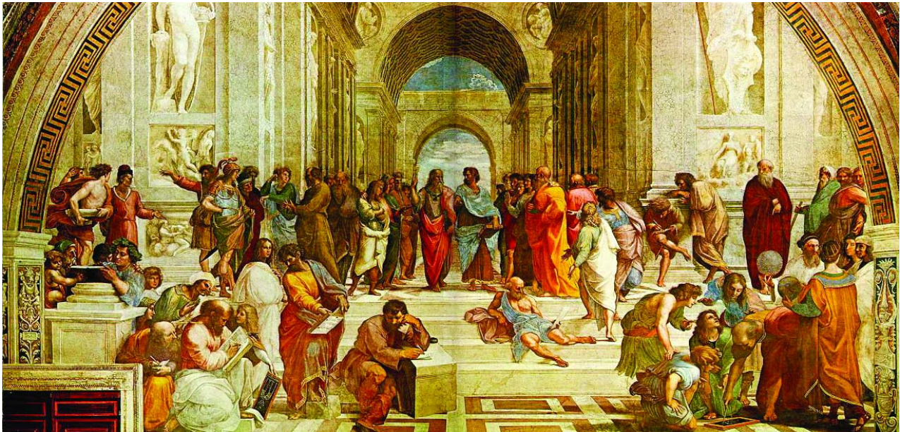
Raphael'in Platon'u öğrencileri ile tasvir ettiği tablosu

Bütün diyaloglarda olduğu gibi, "devlet"te de düşüncelerin hangisi, nereye