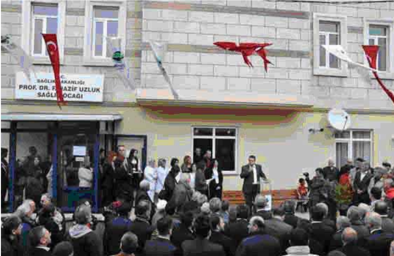
Prof. Dr. Feridun Nâfiz Uzluk Sağlık Ocağı'nın açılış töreninden bir kare