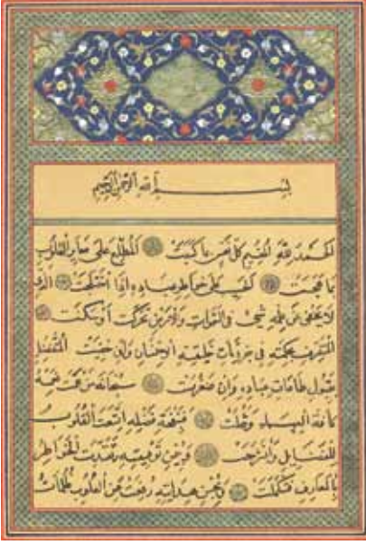
El yazmasından bir sahife.

İkinci bâb başında dişlerin anatomisi hakkında kısaca bilgi veren yazar, bir insanda yaratılıştan yirmi sekiz diş olduğunu, bazı kişilerde dört tane fazla (artık/nevâcid) bulunup toplam otuz iki diş olduğunu söylemekle birlikte, bunlardan yalnızca yirmi dördünü anlatır. Bunlar sivri dişler (nâbiyân, 4 adet), yassivâri dişler (8 adet) ve iri dişlerdir (âdâris, 8 adet).