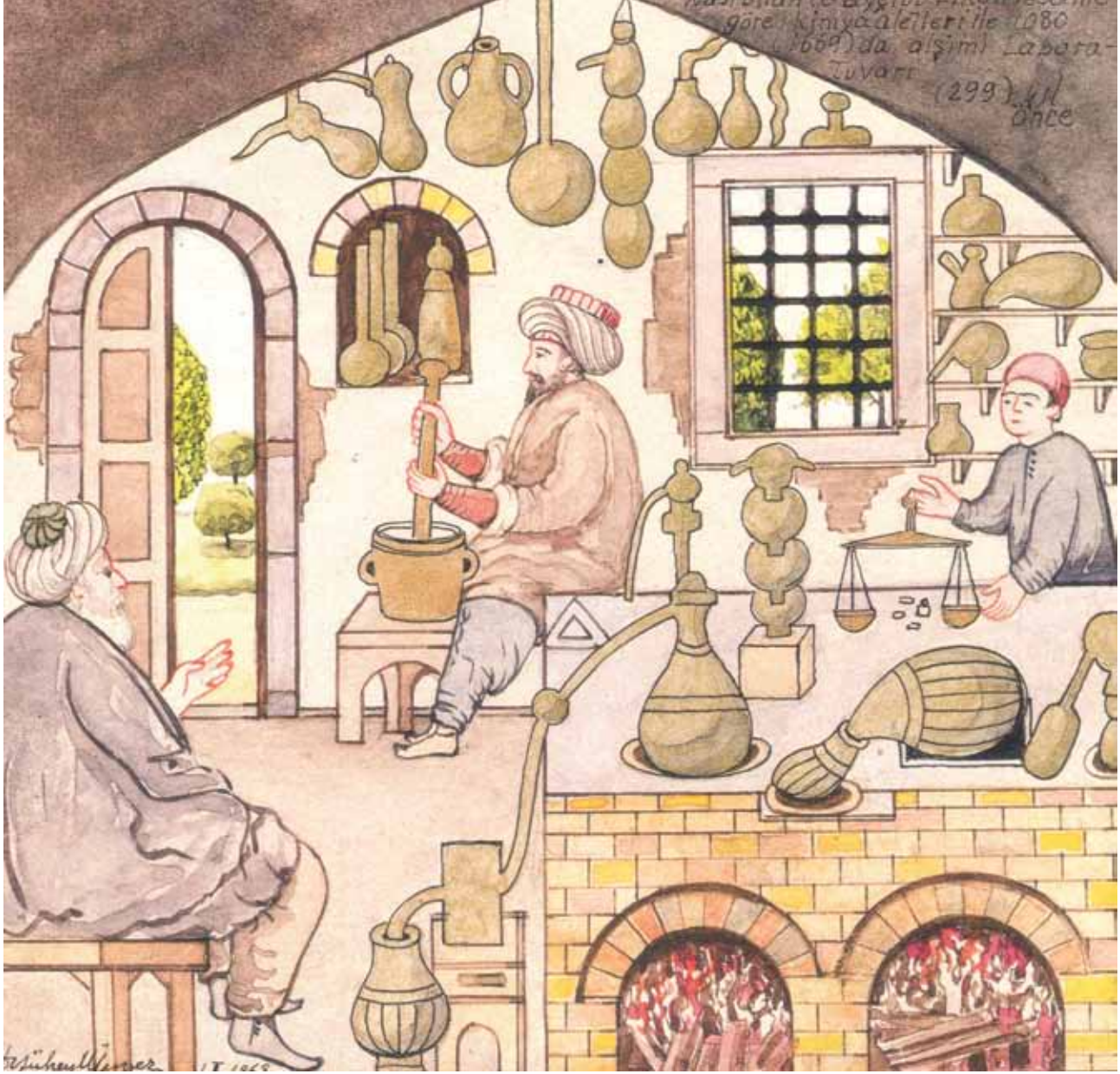
İlaç hazırlayan bir hekim. (Osmanlılarda Sağlık-1 Ed: Dr. Coşkun Yılmaz Dr. Necdet Yılmaz, İstanbul 2006, S:251)

rudan ilişki kurulmasa da, konuların sıralanmasında dişlerin zarar görmemesi için alınacak önlemlere öncelik verilmesi dikkat çekicidir. Yazarın koruyucu hekimlik bağlamında duyarlı olduğu açıktır. Aslında İslâm tıbbi ve devamı olan Selçuklu ve Osmanlı tıbbi öncelikle koruyucu hekimlik üstünde yoğunlaşmıştır. Bunun çeşitli sebeplerinden biri de tedavinin o günün tıp bilgisi ve uygulamaları çerçevesinde çok daha güç olmasıdır.