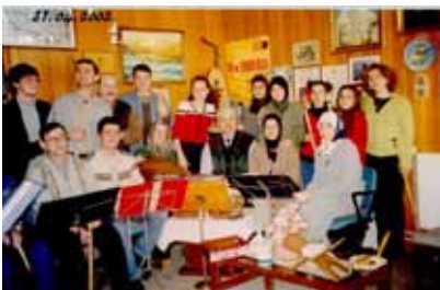
Muayenehanede öğrencilerle meşk. 2002