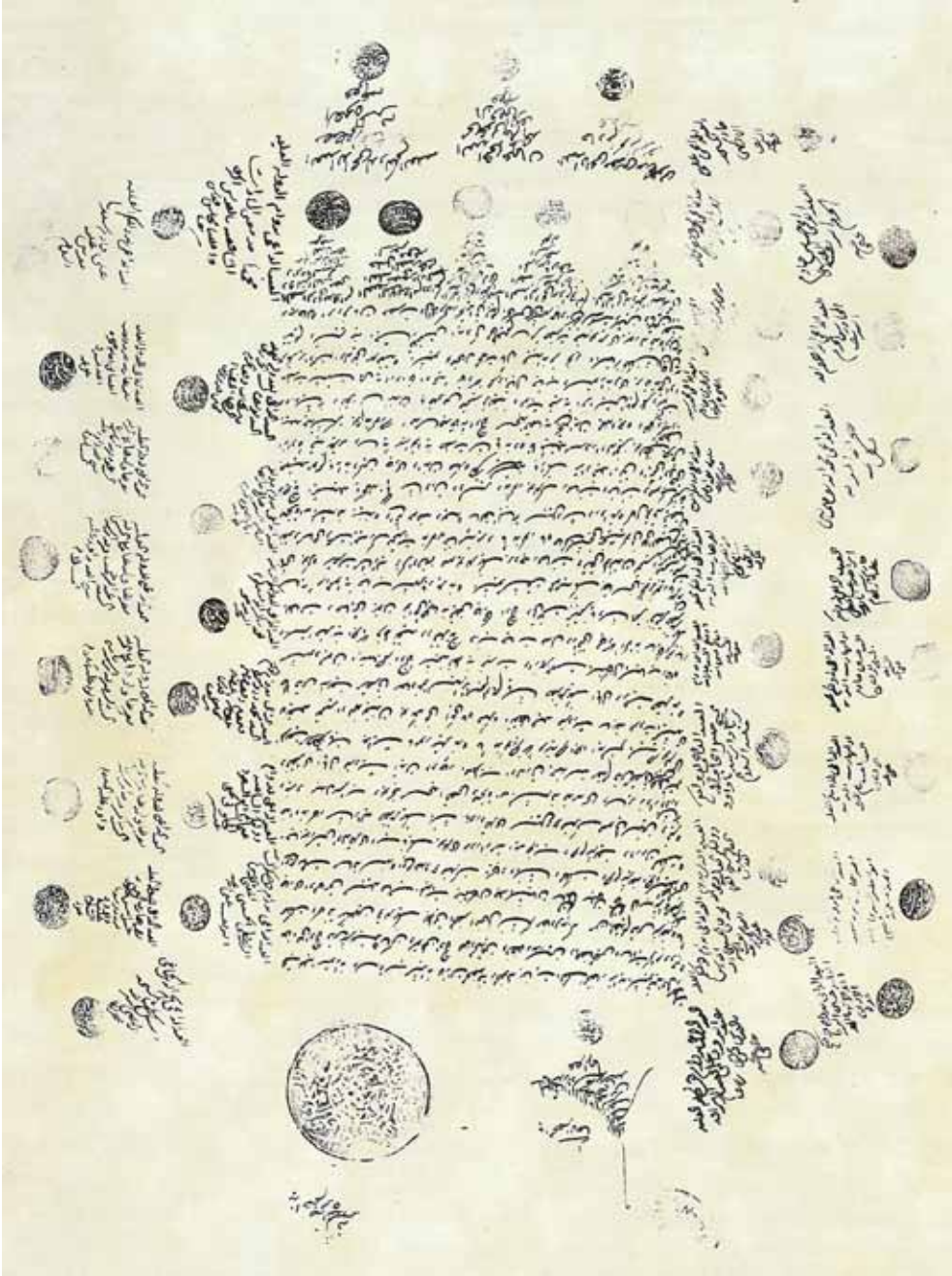
Kudüs'teki su yolları ve havuzların mükemmelen tamirinden dolayı halkın ve şehrin ileri gelenlerinin Mescid-i Aksa'da topluca devlete ve padişaha teşekkür ve dualarını bildiren 1850 tarihli dilekçeleri.

uygulama idi. Bu dönemde sağlıkla ilgili kurumlarda çalışanların maaşları, çeşitli tıbbi malzeme masrafları vakıflardan karşılanırdı. Selahaddin Eyyübi, 1187'de Kudüs'ü Haçlılardan geri aldıktan sonra Bimaristan-ı Salâhî adıyla burada kurmuş olduğu vakıf hastane yüzyıllarca hizmet etmiş, Osmanlı döneminde bu bimaristana vakıf şartlarına göre hekimbaşı, tabip, mütevellî tayin edilmiş; ev, dükkân, fırın, değirmen, zeytinlikler vs. tahsis edilmiştir. Osmanlılar tarafından da bu dönemde vakıf usulüyle benzer kurumlar teşkil edilmiştir.