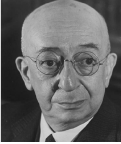
Dr. Refik Saydam

ayrıca 4 alçı model, 5 mulaj, 1 insan iskeleti, bir diş temizliği eğitim modeli, 3 cam kavanoz, 214 kitap bulunmaktadır.