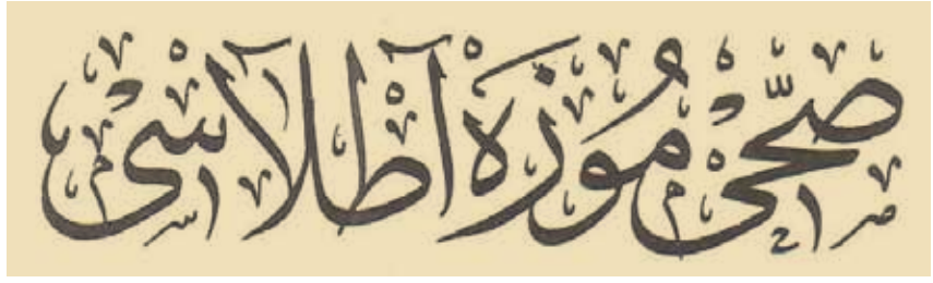
Sihhi Müze Atlasının kapağı

“Sihhi Müze Atlası”nda sıtma (malarya), bel soğukluğu, yumuşak karha, frengi, kolera, dizanteri, tifo (karahumma/humma-yı şebe), verem, çiçek, kızamık, kızıl, kuşpalazı, tifüs (lekeli humma), veba, kuduz gibi bulaşıcı hastalıklar yanında içki belası ve yüksek ökçeler gibi halk sağlığını ilgilendiren diğer konular da tablo ve levhalar ile anlatılmıştır. Frengiye 16 sayfa ayrılmış olması, o dönemde bu