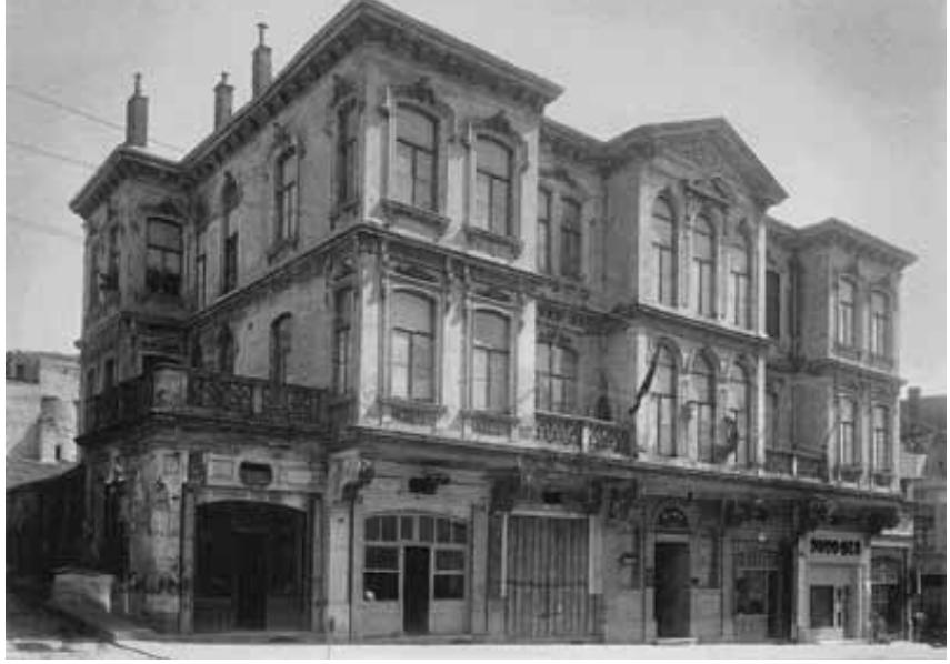
Divanyolu'ndaki Sağlık Müzesi Binasının eski fotoğrafı. (Mimar Sinan Güzel Sanatlar Üniversitesi Fotoğraf Atölyesi Arşivi)

1915 yılında Berlin'e gönderilen Dr. Hikmet Hamdi, Almanya'daki benzeri müesseseleri araştırır ve incelemeler yapar. 1917 yılında yurda döndüğünde Cağaloğlu'ndaki Sıhhiye Umum Müdürlüğü Binasının (Eski Sağlık Müdürlüğü Binası) bir odasında müze hazırlıklarına başlar.