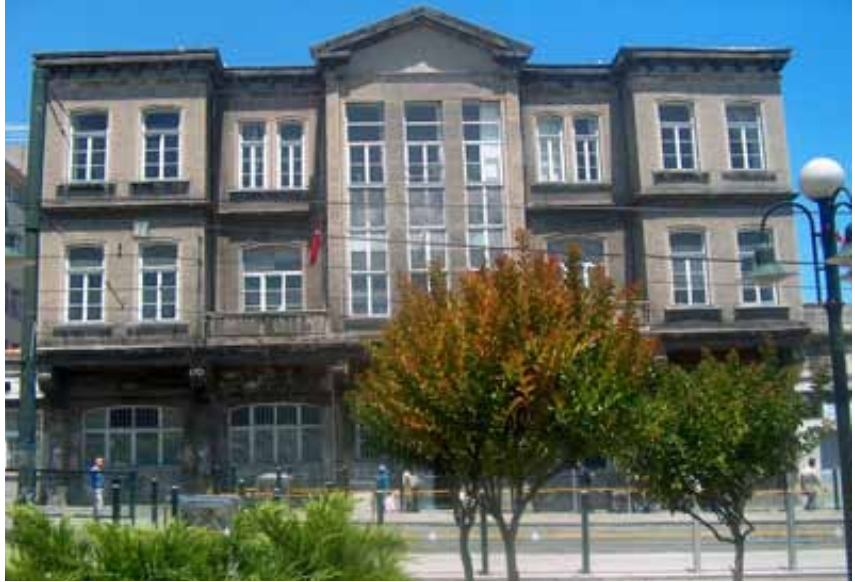
Sağlık Müzesi Binasının şimdiki hali

1915 yılında Berlin'e gönderilen Dr. Hikmet Hamdi, Almanya'daki benzeri müesseseleri araştırır ve incelemeler yapar. 1917 yılında yurda döndüğünde Cağaloğlu'ndaki Sıhhiye Umum Müdürlüğü Binasının (Eski Sağlık Müdürlüğü Binası) bir odasında müze hazırlıklarına başlar.