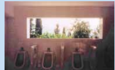
The surprisingly scenic toilets (urinals, actually...) at Maryemana, on a mountain above Ephesus, in western Turkey. There's a better image at: http://www.urinal.net/svm/