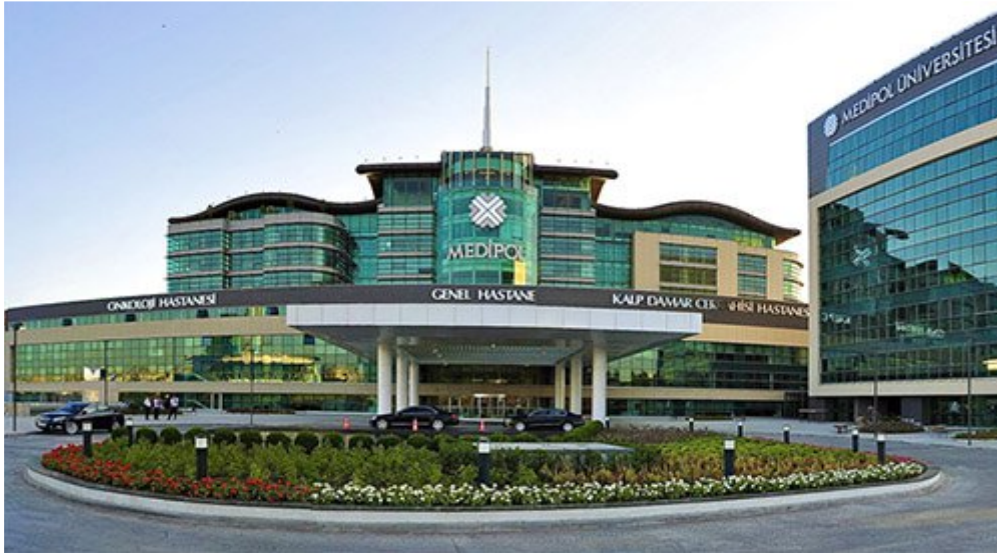
Özel Medipol Mega Hastaneler Kompleksi