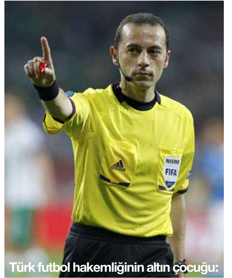
Türk futbol hakemliğinin altın çocuğu:

Mimik ve jestlerini ustaca kullanır, yapacağı konuşmalarda hangi hareketleri yapacağına saatlerce çalışır ve bunları fotoğraflarla kayıt altına alır. Sert bakışlar, ani hareketler ve uzun konuşmalar propaganda amacı ile yapılan ayrıntılardır. Üstün bir insan olduğu lanse ediliyordu. Ölümsüzlük hissi başka bir saplantısıydı. Kardeşleri ölürken kendisinin hayatta kalması ve annesinin aşırı düşkünlüğü, onda özel olduğu hissini uyandırmıştı. Şöyle özetlemişti dünyaya ve insanlara bakış açısını: " Ben dünyaya insanları güçlü yapmak için gelmedim, onların güçsüzlüklerini kullanmak için geldim. Hayat güçsüzlüğü affetmez. Yalan ne kadar büyükse, inananı da o kadar çok olur. Zayıfa acımak doğaya ihanettir. "