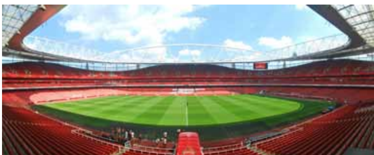
Arsenal'in maçlarını oynadığı Emirates Stadyumu

Londra Metrosu, pek çok turist gibi beni de çok etkiledi. Örümcek ağı gibi örülmüş muazzam metro ağının olması, bende, sanki şehrin altında da bir şehir varmış hissi uyandırdı. Ayrıca bisiklet kullanımının oldukça fazla oluşu,