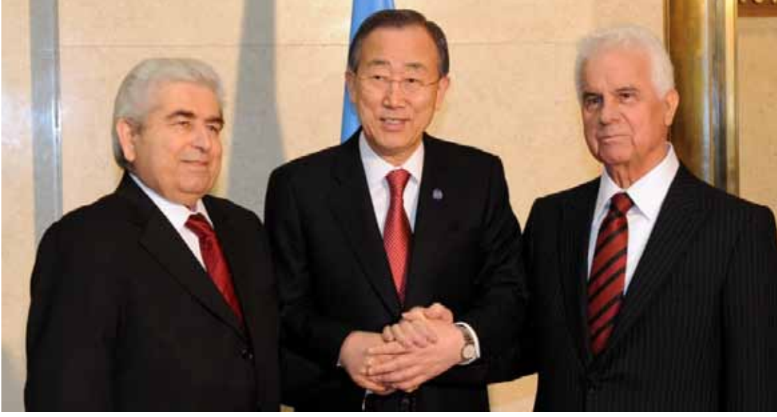
Adada çözüm için görüşmeler halen sürüyor.