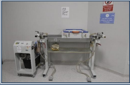
Derin Çekme Makinesi