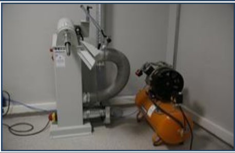
Freze ve Kompresör