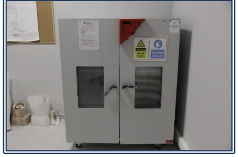
Alçı Kurutma Fırını