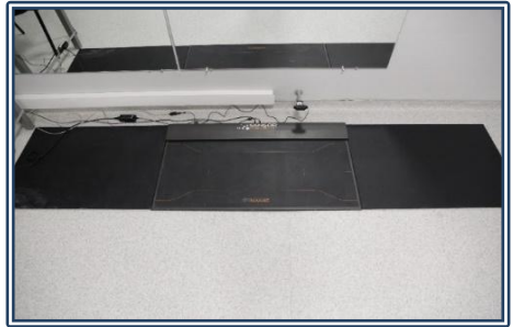
Pedobarografik Analiz Cihazı

Alçı silosu, laminasyon tezgâhı, taş motoru, dekopaj, bant zımpara, ayaklı matkap, dikiş makinesi, Pross Assembly, L.A.S.A.R. Posture, paralel bar ve merdiven parkur ile ortez ve protez yapımı için kullanılan küçük el aletleri kullanılmaktadır.